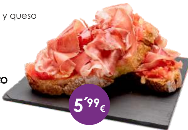
Pan Tumaca CON JAMÓN IBÉRICO