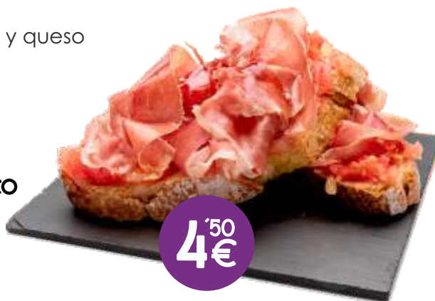
Pan Tumaca CON JAMÓN IBÉRICO